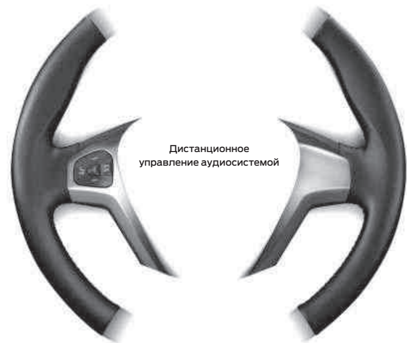
Дистанционное управление аудиосистемой

Наполните салон автомобиля Ford Fiesta любимой музыкой и установите связь с внешним миром при помощи мультимедийной системы Ford SYNC