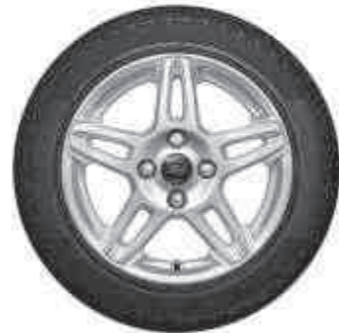
15" 5x2-спицевые легкосплавные колесные диски