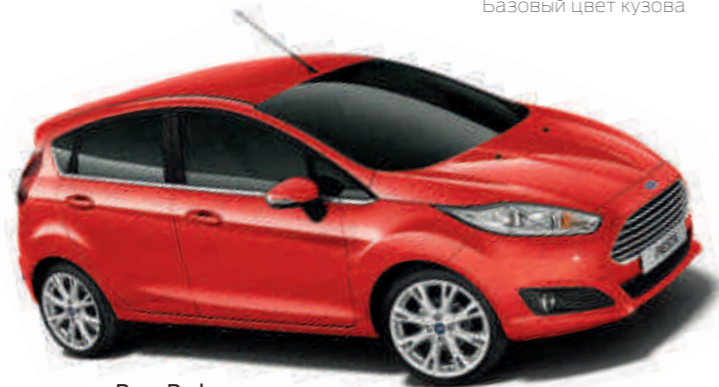
Race Red Базовый цвет кузова