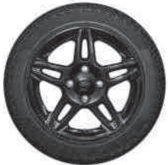
15" 5x2-спицевые легкосплавные колесные диски черного цвета