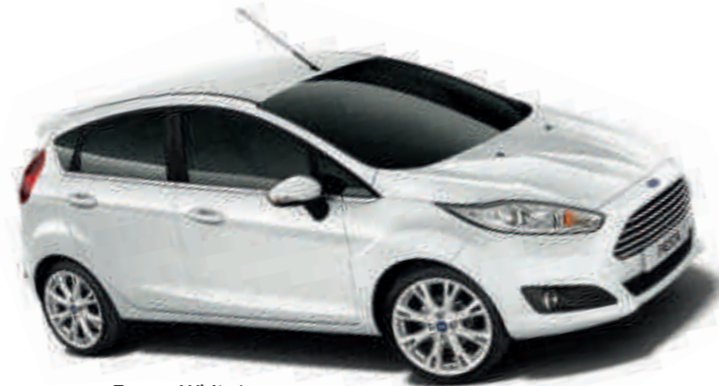
Frozen White* Базовый цвет кузова