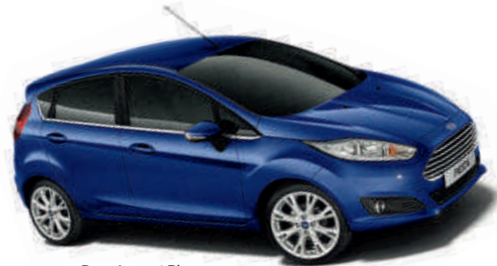
Deep Impact Blue Цвет кузова с эффектом "металлик" *