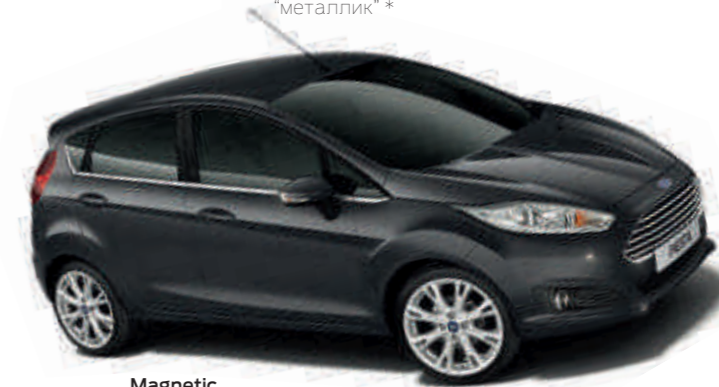
Magnetic Цвет кузова с эффектом "металлик" *