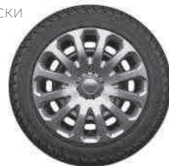
15" стальные колесные диски с декоративными колпаками