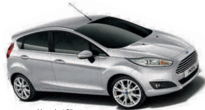
Moondust Silver Цвет кузова с эффектом "металлик" *