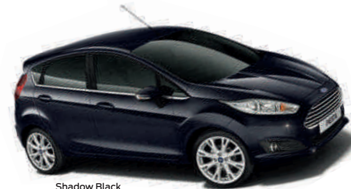
Shadow Black Цвет кузова с эффектом "металлик" *