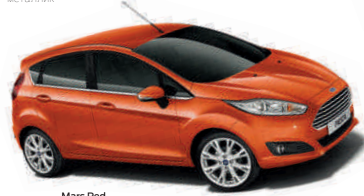
Mars Red Цвет кузова с эффектом "металлик" *